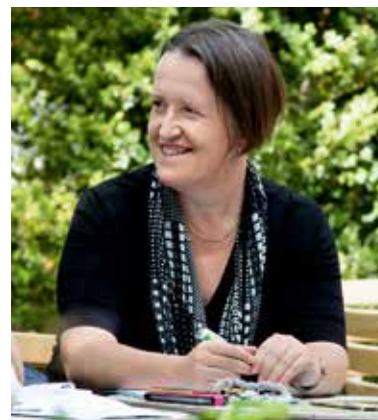
Professorin Karin Kovar.

Wie überall braucht es die richtige Dosis an Begeisterung und Zurückhaltung. Beim Aufbau eines weitreichenden fachlichen wie persönlichen Netzwerkes sind die Grenzen zwischen Forschungsinteresse sowie privatem und beruflichem Einsatz oft fließend. Das sind Aktivitäten, die im Umfang der normalen Stunden für Unterrichtsvorbereitung nicht machbar wären. Für mich ergeben sich dadurch aber auch viele Synergien. Ich kann durch den Kurs viel Vorarbeit für meine Forschungstätigkeiten leisten. Ich lese viel und kann mit den Studierenden und den Industrie-Coaches Inhalte kritisch diskutieren. Somit ist der Mehraufwand vertretbar, weil ich mich selber stets weiterbilde, und das macht Freude. Das NBO-Konzept beweist alltäglich: Gute Lehre kann man nicht von der aktuellen Forschung trennen. Qualifizierte Lehrpersonen müssen in beiden Bereichen selber aktiv sein.